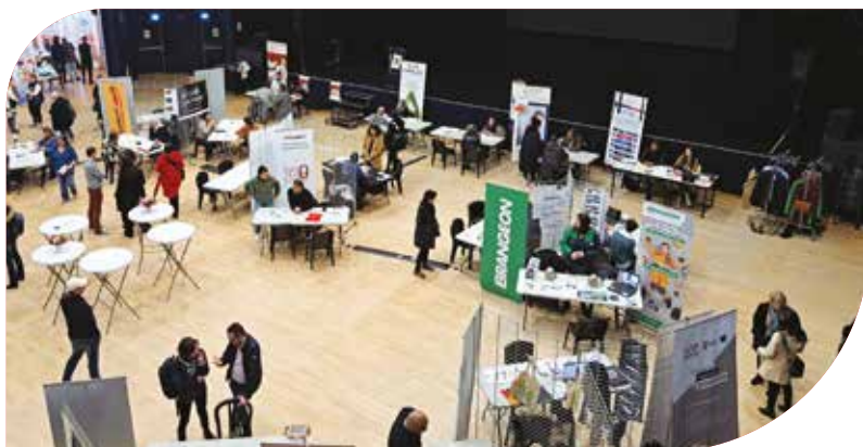
Forum de l'emploi , le jeudi 28 mars, la commune de Saint-Loubès a organisé le 8 ème Carrefour de l'Emploi avec France Travail à La Coupole. Soixante recruteurs de tous les secteurs d'activité, avec les partenaires (l'association des Hauts de Garonne, le club des entreprises, la Mission locale et Haut de Garonne Développement), proposaient 300 offres d'emploi cette année. Le CIAS de la Communauté de communes Les Rives de la Laurence était représenté afin de recruter de nouvelles aides à domicile.