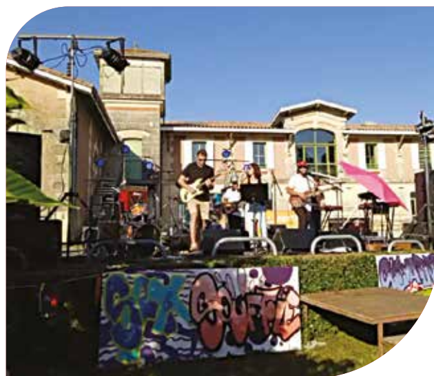
Festi'Lalie , début du festival Festi'Lalie le 5 juillet dernier. Soutenu par la Communauté de communes Les Rives de la Laurence, ce festival qui se déroule chaque vendredi de l'été, fait la part belle aux musiques du monde et aux groupes locaux. Une programmation pointue et ouverte à tous.