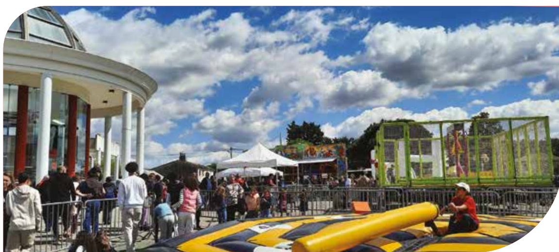
Festival du jeu , organisé par la mairie de Saint-Loubès, avec le soutien de la Communauté de communes Les Rives de la Laurence. Du 13 au 18 avril, les petits comme les grands se sont retrouvés à La Coupole pour s'amuser et découvrir de nombreux jeux et animations.