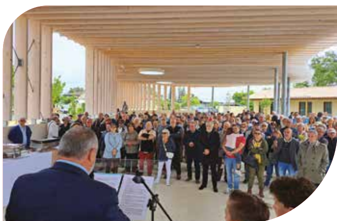
Infrastructures , le 15 juin dernier, le président Frédéric Dupic était aux côtés de Pierre Cotsas et des élus de Saint-Sulpice-et-Cameyrac pour l'inauguration de la toute nouvelle Halle au cœur du bourg. Réalisée avec l'appui de la Communauté de communes Les Rives de la Laurence grâce à un fonds de concours, elle accueillera de nombreuses animations associatives et municipales.